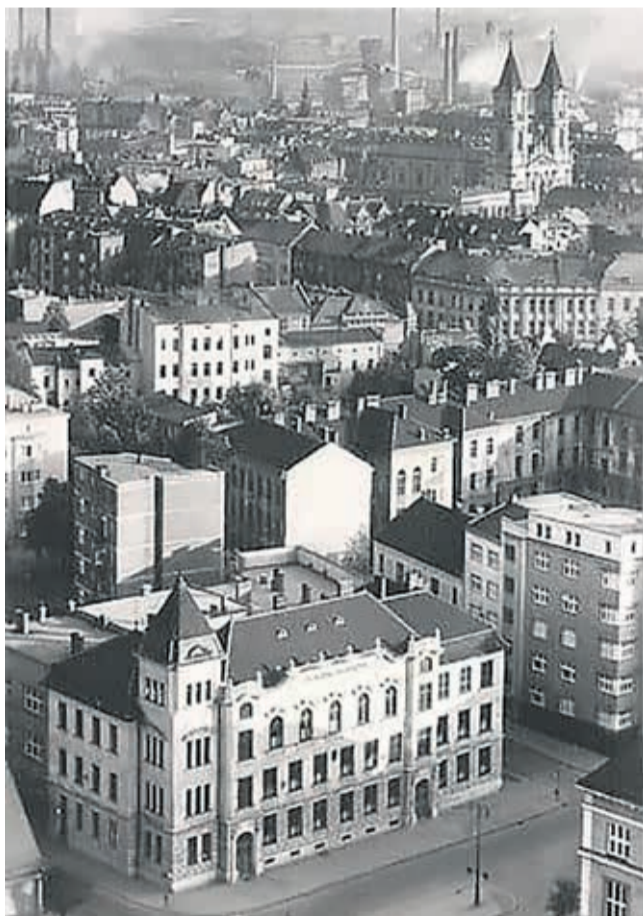
Původní budova Německé obchodní akademie v Ostravě.

Samozřejmě. Ekonomická fakulta bude organizačně zajišťovat výuku ve čtrnácti ekonomicky zaměřených studijních programech pokrývajících celou obvyklou šíři univerzitního ekonomického vzdělání v českém i anglickém jazyce a bude participovat na výuce a výzkumu v bakalářských, navazujících magisterských a doktorských studijních programech. Avšak čtyři z těchto programů budou vyučovány prostřednictvím našeho výukového centra University of London.