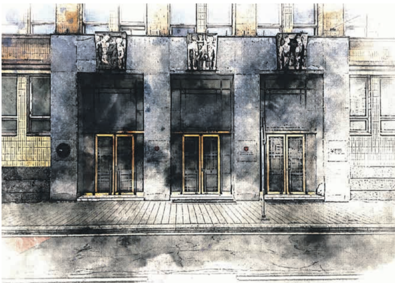
Budova Ekonomické fakulty Evropské výzkumné univerzity (2024).

Téměř v každém. Na univerzitě máme velmi vysoké procento studentů ze zahraničí, podíl programů vyučovaných v českém a anglickém jazyce je nyní přesně proporcionální a od příštího akademického roku budeme realizovat, i díky nově uzavřené smlouvě s University of London, téměř dvě